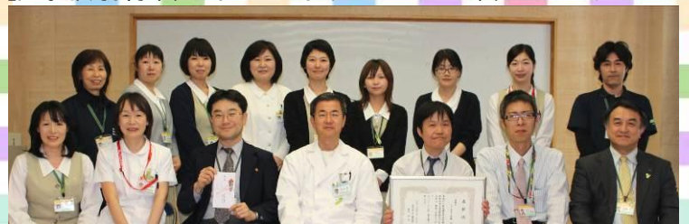
事務局のスタッフ