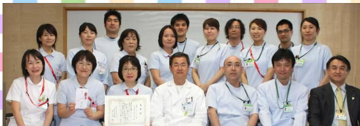
5階病棟看護師とリハビリテーション科のスタッフ