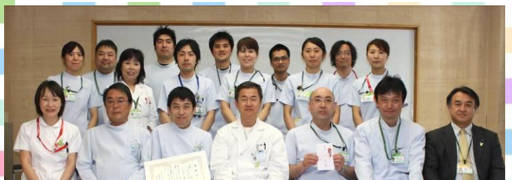
診療放射線科とリハビリテーション科のスタッフ