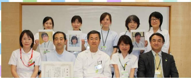
臨床検査科のスタッフ

表彰を受けられた各部門等の皆さん、大変おめでとうございます。今後の一層の飛躍・活躍の期待いたします。