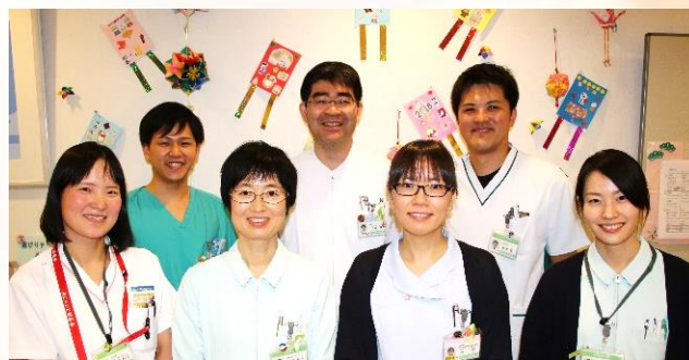
今年度のNSTメンバー

NSTはすべての入院患者さんの栄養状態を評価し、適切な栄養療法を提言・選択・実施します。そして患者さんの栄養状態の改善・治療効果の向上・合併症の予防・QOL（生活の質）の向上・在院日数の短縮・医療費の削減などを活動目的としています。