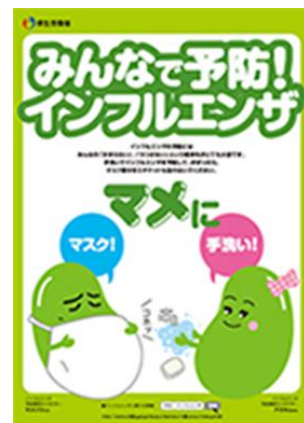
★厚生労働省のポスター★