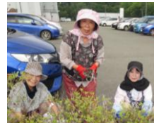
6/19福祉ボランティアの会